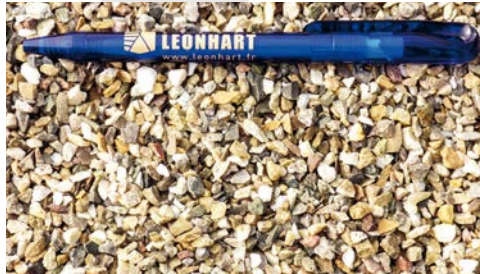
2/4 concassé lavé