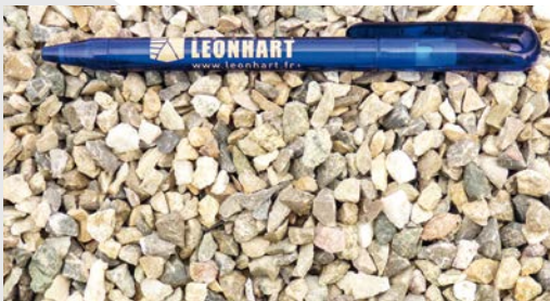
4/6,3 concassé lavé