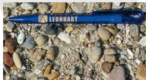
Mélange roulé 0-16