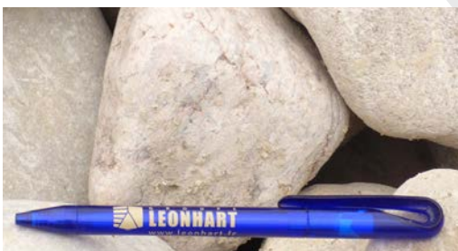
Galets du Rhin 80-120